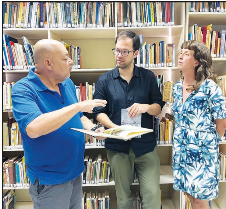
Siman pasá djabièrnè dos funshonario di GreenPeace tabata di bishita na FuHiKuBo. E hòmer ta abogado di GreenPeace. E señora ta trahando temporalmente na Bonaire pa GreenPeace.

bia deklarashon, reakshoná bisa ku nan no a bisa asina. Mi ta splik'é ku ta kosnan ku mi tambe a pasa aden durante mi karera di mas ku 45 aña den prensa. Mi ta spera ku Dios lo dunami suficiente aña mas di bida pa mi skirbi tur loke m'a pasa aden den prensa boneriano komo skirbidó di korant. Tin biá e ta bunita, otro biá e ta kombertí den 'thriller'.